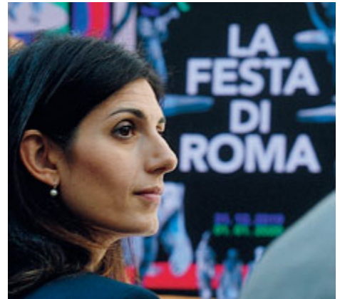
Un momento della conferenza stampa di ieri.

Il Capodanno romano inizierà la sera del 31 dicembre e terminerà la sera del primo gennaio, quindi 24 ore di festeggiamenti che vogliono richiamare, nel ciclo di una giornata, la rotazione del nostro pianeta. I cinque ecosistemi si snoderanno lungo l'area a disposizione della festa, da piazza dell'Emporio a ponte Fa-