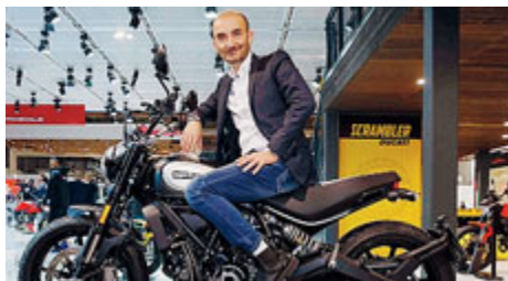
Claudio Domenicali, ad di Ducati.

MOTO Tutte le novità del 2020 sono presenti nei padiglioni della padiglioni di Fiera di Milano-Rho in occasione dell'edizione 2019 di EICMA, l'Esposizione Mondiale del Motociclismo che rappresenta da sempre uno degli appuntamenti europei più importanti per le due ruote. Il Salone resta aperto fino a domenica (oggi 9.30-22, domani e domenica 9.30-18.30). Il prezzo del biglietto è di 23 euro, gratis i bambini fino agli 8 anni, mentre i 9-13enni e gli