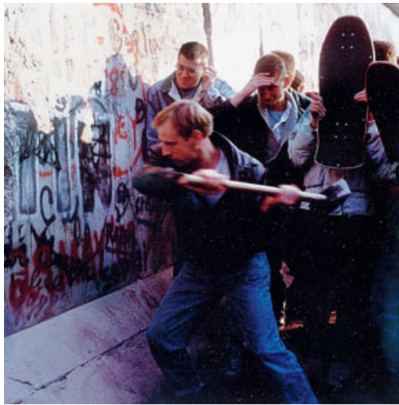
Le iniziative spontanee dei berlinesi per abbattere fisicamente il Muro.

10 SETTEMBRE 1989 L'Ungheria apre i suoi confini con l'Austria. Un numero consistente di tedeschi dell'est approfittò per andare all'Ovest. In Germania Est scoppiarono proteste e disordini. Il regime di Honecker ordina di farla finita con provocazioni e dimostrazioni.