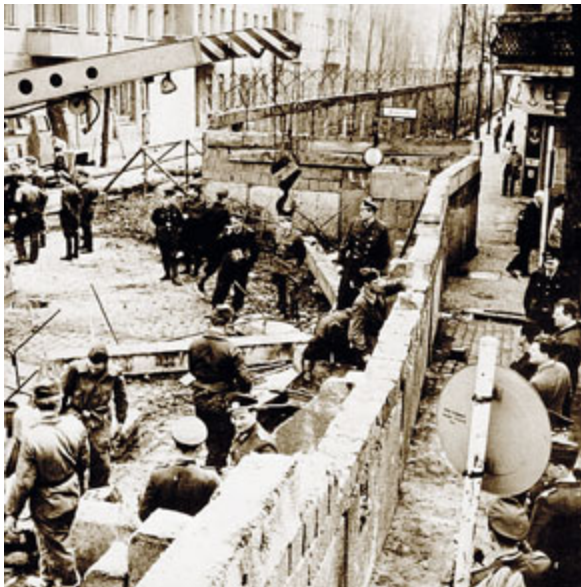
Lavori per tirare su il primo Muro a Berlino Est.