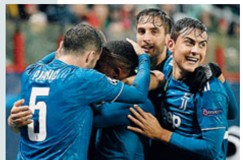
La festa Juve a Mosca. /LAPRESSE

Partenza sprint dei padroni di casa che si rendono pericolosi dopo tre minuti con Jony. Al 7' Lazio in vantaggio con il solito Immobile: cross dalla destra di Lazzari, contrasto aereo in mezzo che diventa un ulteriore appoggio per il destro al volo, con l'interno, del 29enne napoletano che batte il portiere sul primo palo. Poco dopo però il bober sbaglia una chiara occasione. Al 38' doccia fredda per l'Olimpico e pari scozzesi: Forrest supera Strakosha con un destro potente. La squadra di Inzaghi prova subito a reagire e costruisce una doppia opportunità. L'avvio di ripresa è di marca Celtic, con le proteste della Lazio per un tocco sospetto di mano in area. Il finale sembra di marca biancoazzurra, ma invece arriva la beffa di Ntcham.