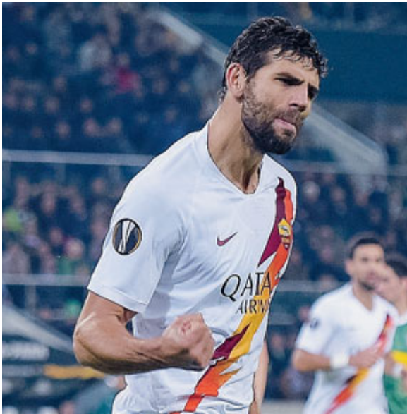
Federico Fazio protagonista del match.

CALCIO Archiviato l'amaro turno Champions, l'Inter si rituffa in campionato con l'auspicio che le scorie - fisiche e mentali - post-Dortmund siano ormai smaltite. Ancora una volta il calendario offre alla squadra nerazzurra l'opportunità di essere regina almeno per una notte, giocando sabato a San Siro col Verona, che pure ha vinto le ultime due partite. L'ultima fatica prima di una sosta che per la coperta corta di Conte è un dono dal cielo. Ennesima tegola infatti sulla rosa: lo stop di Politano, una delle due sole alternative, insieme al baby Esposito, alla coppia d'oro Lukaku-Lautaro Martinez, destinati ancora a vestire i panni degli stakanovisti in un attacco già privo di Sanchez. Politano starà fermo almeno un mese. La buona notizia è il ritorno dal 1° di Sensi. Da valutare Gagliardini, appare difficile il recupero di D'Ambrosio e Asamoah.