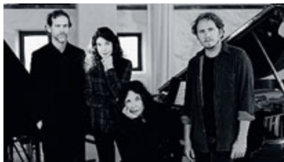
Domenica al Parco della Musica.

Ricco e articolato il programma del primo gennaio che vedrà susseguirsi concerti e spettacoli che si terranno in diversi spazi della città da lungotevere, dove sfilerà l'Orchestra Popolare Italiana, alla Bocca della Verità che ospiterà lo Spider Circus del Group Laps. Ingresso libero.