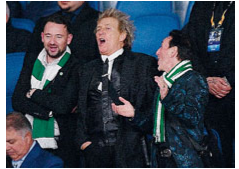
Rod Stewart ieri all'Olimpico.

per 5 anni. Quattro di loro, prima di entrare allo stadio sono stati trovati con fumogeni e fuochi artificiali. Altri due, sprovvisti di biglietto, hanno prima spintonato due steward ai tornelli, poi hanno tentato di corromperli per entrare infilando nelle loro tasche delle banconote. Infine un tifoso scozzese ubriaco, che cercava di raggiungere gli spalti con un biglietto intestato a