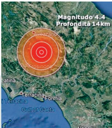
La scossa di ieri nell'aquilano.