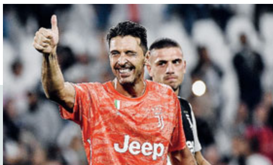
La sua ultima gara di Champions con la Juve risale al 11 aprile 2018

ATLETICA Il Tribunale Federale di Losanna ha respinto il ricorso di Alex Schwazer, che chiedeva la sospensione della squalifica di otto anni per doping. Un ricorso presentato dopo l'emergere dell'ipotesi di una possibile manipolazione delle urine. Ma il Tribunale, rendono noto i legali dell'atleta, non ha concesso la misura cautelare richiesta perché «non risulterebbe con estrema verosimiglianza fondata e cioè che non risulterebbe con assoluta certezza la relativa prova». «Sulla base di questa valutazione - comunicano i legali - Schwazer coltiverà il procedimento in oggetto nella convinzione di poter fornire ulteriori elementi di prova a supporto dell'invocato provvedimento e del accertamento della manipolazione della sua prova prelevata il 1° gennaio 2016».