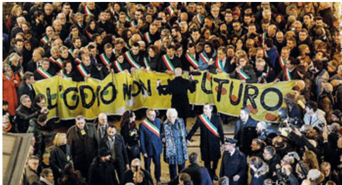
Liliana Segre in Galleria Vittorio Emanuele circondata dai sindaci.

Un momento molto commovente è stato quando il presidente dell'Anci Decaro ha consegnato la fascia tricolore a Liliana Segre in nome di tutti i Comuni italiani: è scattato un coro spontaneo che ha intonato Fratelli d'Italia, applausi e grida «Liliana Liliana» in tutta la piazza gremita.