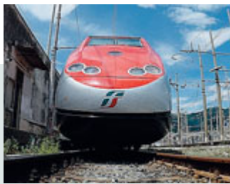
Più collegamenti con Venezia.