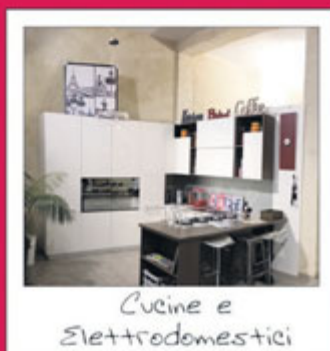
Cucine e Elettrodomestici