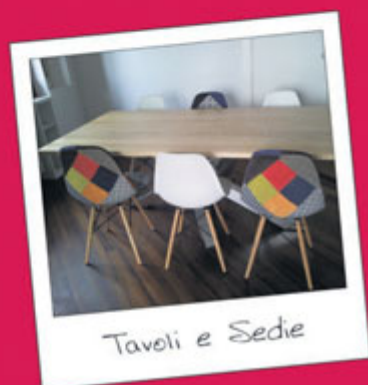
Tavoli e Sedie