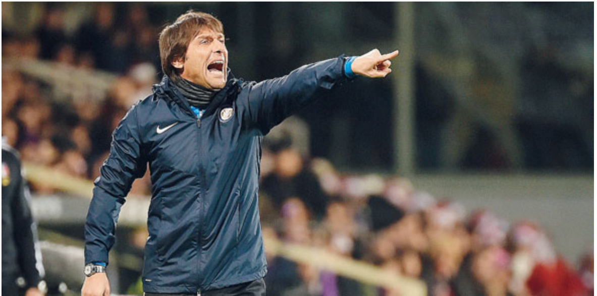
Antonio Conte si sbaccia e urla dalla panchina. Ieri sera a Firenze l'Inter ha subito il pari dopo che era stato annullato dal VAR il possibile raddoppio di Lautaro.

BASKET Il big match di giornata era Venezia-Milano, ovvero i campioni d'Italia (in difficoltà: sono a meno 4 dalle prime otto) contro i favoritissimi per lo scudetto: hanno vinto questi ultimi (70-71) grazie a una tripla pazzesca di Micov a cinque secondi dalla sirena che fa così parzialmente dimenticare i quattro ko di fila in Eurolega. L'AX resta seconda dietro la Segafredo Bologna, vincitrice contro Brindisi, in compagnia di Sassari (86-80 sulla Fortitudo). Splendida Roma, che fa un enorme passo avanti verso la Final Eight di Coppa Italia imponendosi a Trento (82-88, Dyson 23). In serata, Pistoia-Cremona 84-71. DOM.LAT.