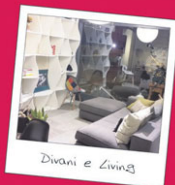
Divani e Living