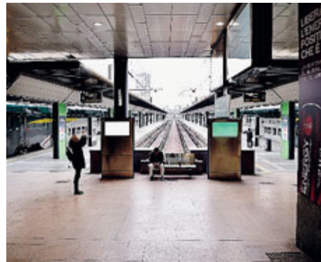
Una Stazione di Cadorna deserta ieri pomeriggio.

oggi. Ma, sciopero a parte, ciò che dovrebbe preoccupare gli utenti è l'innalzamento dello scontro tra Trenord e l'Or.s.a., sindacato maggioritario tra i lavoratori della società. Tanto che il sindacato in un comunicato ha rievocato il 2012, anno che vide ben 13 scioperi consecutivi. A Trenord Or.s.a. chiede una "gestione aziendale in grado di garantire qualità del servizio, rispetto degli accordi sottoscritti e trasparenza: nelle assunzioni, nei trasferimenti, nella gestione del personale". Sabato notte, invece, ritardi e blocchi anche sulla linea Rossa del metrò a causa dell'investimento di una persona nella stazione di Pasteur. L'uomo, un 24enne che si trovava sui binari, è deceduto sul colpo. S'indaga per capire se si è trattato di un atto volontario.