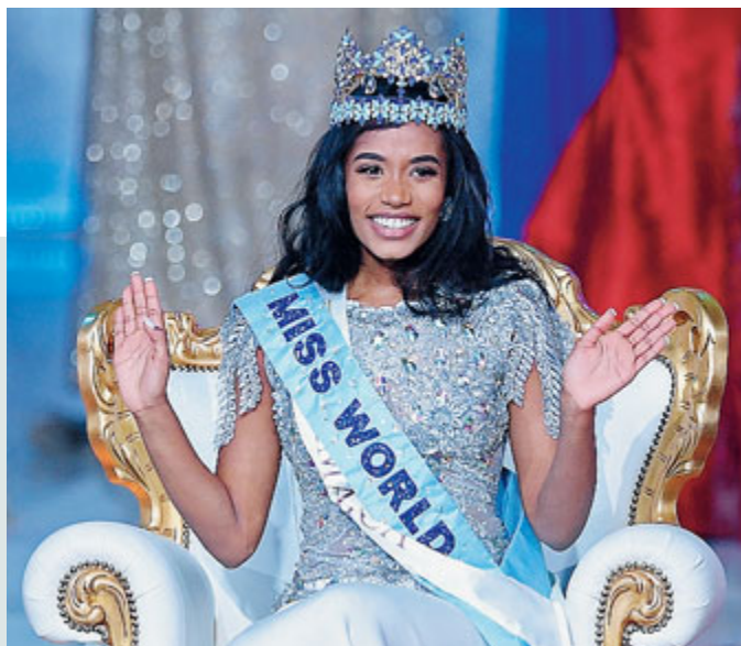
La psicologa giamaicana Toni-Ann Singh eletta Miss Mondo.

Oggi si terrà un vertice di maggioranza, ma non sulla manovra che a questo punto dovrebbe essere chiusa. Anche i tre senatori grillini chesono passati alla Lega non dovrebbero mettere ora a rischio la maggioranza.