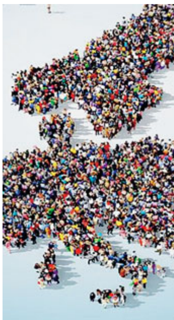
A disposizione 14 milioni di euro.