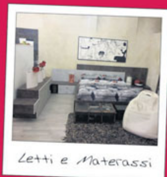
Letti e Materassi