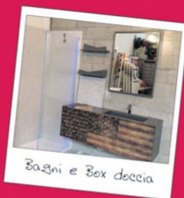
Bagni e Box doccia

Showroom: Via Gasparotto 66, Varese - Tel. 331 96 48 249