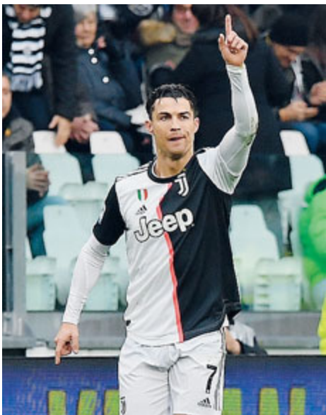
Ronaldo rinato: doppietta.

CALCIO Oggi, alle 12 e alle 13, a Nyon, verranno sorteggiati gli ottavi di finale di Champions League e i sedicesimi di Europa League.