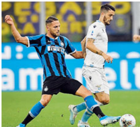
D'Ambrosio (all'andata decisivo il suo gol) e Luis Alberto.

CALCIO «Voglio vincere la Champions, la sto sognando e sono entusiasta all'idea di preparare la partita contro il Real Madrid (agli ottavi di finale, ndr) nelle prossime due settimane. Ma se non battiamo il Real allora il presidente o il direttore sportivo verrà a dirmi "non è abbastanza, vogliamo la Champions". Mi vorranno esonerare? Ok, grazie, è stato un piacere». Lo ha dichiarato a Sky Sports il tecnico del Manchester City Pep Guardiola. Che ha aggiunto: «Se un tennista gioca la finale di un Master o dell'Open d'Australia e arriva 2° non è un fallito. So bene che il City punta alla Champions, ma la cosa più importante è essere orgoglioso di come gioca la tua squadra. Dicendo che contano solo le vittorie e i trofei mandiamo un pessimo messaggio alla nuova generazione, a tutti i bambini». Pep il più forte? «Con squadre deboli non vincerei». Grande.