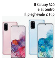
Il Galaxy S20 e al centro il pieghevole Z Flip

tele da 64. Strepitosa la scommessa sullo "Space Zoom", che nell'Ultra arriva a 100x digitale e nei fratelli minori si ferma a 30x. Le frontali spaziano invece da 10 a 40 Mpixel. Batterie capienti da 4.000, 4.500 e 5.000 mAh, gli smartphone che supportano tutto il possibile, dal riconoscimento facciale al sensore d'impronta integrato, possono ospitare fino a 1TB di memoria interna. Disponibili dal 13 marzo, costeranno dai 929 ai 1.379 euro, a seconda di versioni. Lo Z Flip (fra le specifiche chip Snapdragon 855+, 8 Gb di Ram, 256 di memoria) costerà invece 1.520 euro e rappresenta una scommessa. Non solo perché inaugura una nuova famiglia di prodotti ma perché abbassa il livello di entrata al mondo dei pieghevoli, moltiplicando le possibilità d'uso grazie a un ambiente progettato con Google che divide lo schermo in due parti quando si piega il dispositivo a 90 gradi. Esce proprio oggi, nelle tinte "mirror purple", "mirror black" e in "mirror gold".