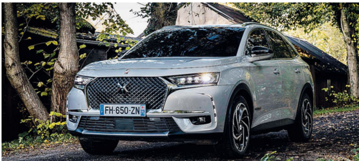
La DS 7 Crossback