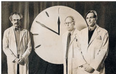
Il Doomsday Clock fu istituito dagli scienziati che avevano lavorato al Progetto Manhattan

Le 23,43 del 1991 sono state il momento di maggior serenità segnata dall'Orologio dell'Apocalisse. Già nel 1995 si era tornati a -14, poi nel 1998 a -9, nel 2002 a -7 e nel 2007 a -5.