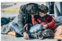
Profughi a Mitilene.

migranti che dal lato turco sperano di entrare in Europa. La presidente del-