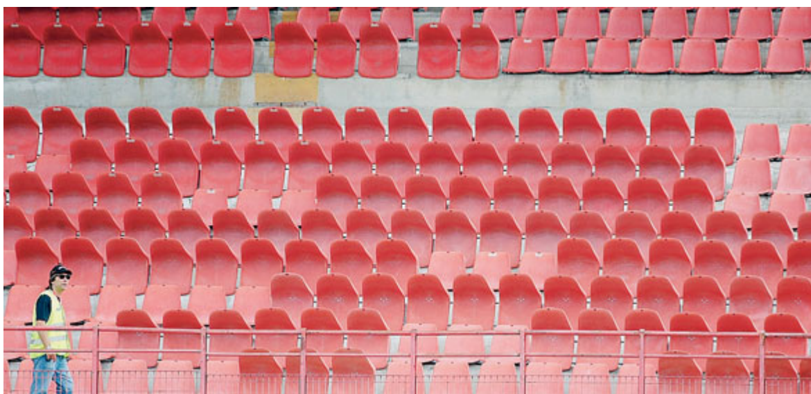
L'emergenza Coronavirus sconvolge come mai nulla prima anche i calendari sportivi.