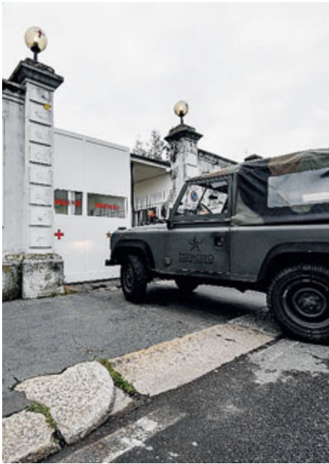
Pronto l'ospedale militare a Baggio.