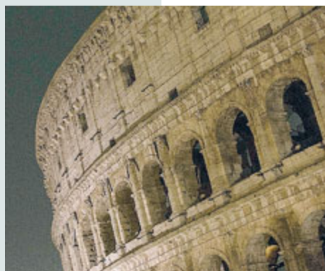
Il Colosseo, tra i monumenti che si spengeranno

l'Ambiente passando per Fai e il Consiglio Nazionale delle Ricerche, oltre che per le numerose ambasciate straniere in Italia. Si spengono da sempre piazze e monumenti (Torre di Pisa, Colosseo, Arena di Verona, Quirinale, Senato e Camera). Centinaia di Comuni e aziende che stanno piantando alberi per contribuire al più grande progetto di Forestazione Urbana. L'obiettivo è piantare un filare di 500.000 alberi, che unisca Pino Torinese con Alberobello,