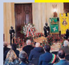
Il feretro in Sala Alessi.

parso venerdì all'età di 82 anni. Il feretro è stato scortato dalla famiglia in piazza Scala, prima di avviarsi ad una sepoltura privata. «Tognoli era uno che c'era sempre per chi aveva bisogno», ha detto il sindaco Sala.