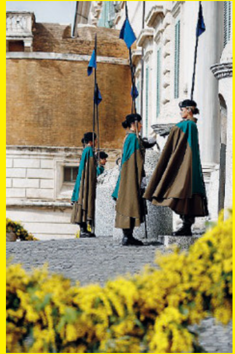
Al Quirinale torna la festa

Violenza C'è poi il capitolo violenza. E a ricordarlo è la ministra dell'Interno Lamorgese: nell'anno passato, caratterizzato da lockdown, «a fronte di un calo di omicidi, è aumentato il numero delle donne uccise e ancor più è cresciuto quello delle donne che hanno trovato la morte per mano di un marito, di un compagno o di un ex partner». L'8 marzo deve anche «obbligare a porre il massimo dell'attenzione sulle discriminazioni e sulle violenze che subiscono ancora troppe donne anche nel nostro Paese. Discriminazioni e violenze che hanno conseguenze per l'intera società».