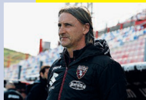
Davide Nicola ieri a Crotonese.

per il Torino (che ha terminato la partita in dieci per doppia ammonizione a Rincon) in gol Mandragora al 45' e Sanabria all'84', un gol, quest'ultimo, che aveva fatto sperare in un pari in extremis, sfumato per poco (colpo da fuori di Gojak e Cordaz devia sul legno). Un palo aveva negato a Bonazzoli il 2-1. Una giornataccia.