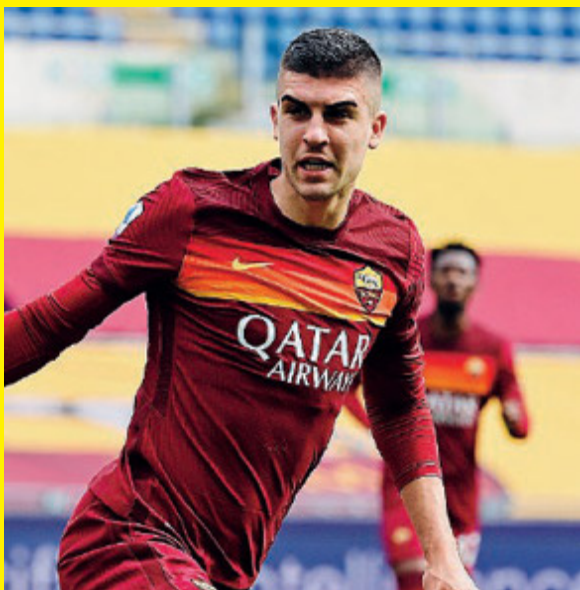
Di Mancini il gol-partita.