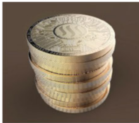
LO STUDIO SI OCCUPA DI CRIPTOVALUTE, MONETE DIGITALI

Chi lo desidera può richiedere una consulenza fruita direttamente dal sito web ( https://www.bitcounseling.com/home-page ).