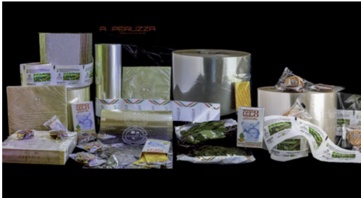
GLI IMBALLAGGI ECOSOSTENIBILI COPRONO LE ESIGENZE DI TANTI SETTORI PRODUTTIVI, NON SOLO L'ALIMENTARE