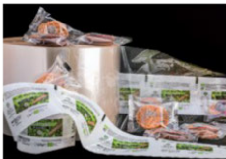
PRODOTTI CHE MINIMIZZANO LE EMISSIONI DI CO2

Da un lato una ridotta emissione di gas serra, dall'altro lo smaltimento sotto forma di compost