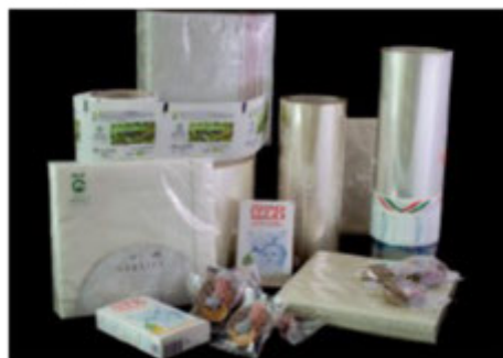
I FILM POSSONO ESSERE TRAFORMATI IN COMPOST A CICLO VITA CHIUSO

La ricerca portata avanti da A. Peruzza Srl ha portato allo sviluppo in particolare di due generi di soluzioni. Da un lato il cellofane biocompostabile, ricavato dalla cellulosa proveniente da foreste gestite con criteri ecologici, e disponibile in diverse varianti (trasparente, bianco, metallizzato). Dall'altro il film di PLA biocompostabile, (Poli Lattic Acid, acido polilattico), chimicamente una variante del poliestere, ma che viene ricavato dagli amidi. Tra questi sono particolarmente utilizzati l'amido di mais e della canna da zucchero.