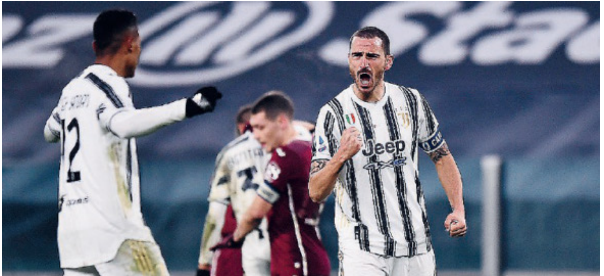
Bonucci decisivo nel derby d'andata.

TENNIS Sarà lo spagnolo Agut, n° 12 Atp, a vedersela con Jannik Sinner (dopo la vittoria dell'altoatesino contro Bublik) nella semifinale del Masters 1000 di Miami. Lo spagnolo ha eliminato il favorito Medvedev con un tondo 6-4, 6-2. Sinner e Bautista Agut si sono già affrontati al torneo di Dubai, due settimane fa quando vinse l'azzurro. Sinner non è più una semplice "promessa". Per Pietrangeli «più che bravo o bravissimo non posso dirgli...forse è un po' troppo panzer, dovrebbe raffinare il gioco». Per Barazzutti «È un fenomeno, unisce colpi strepitosi a un equilibrio mentale davvero invidiabile. Può vincere a Miami e con un pizzico di fortuna anche un torneo dello Slam già nel 2021». Come il 19enne Musetti, appena entrato nei primi 100: «un predestinato, ha un talento incredibile e colpi eccezionali. Ha un grande futuro».