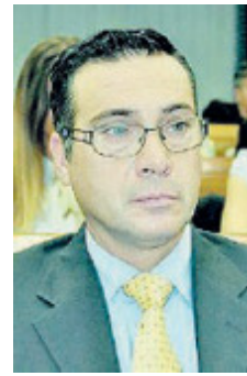
L'ufficiale Walter Biot.

Comunque il caso potrebbe finire al centro di un conflitto di giurisdizione tra procura ordinaria e militare: nelle prossime settimane i vertici delle due procure si vedranno per confrontarsi.