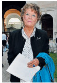
Dacia Maraini / LAPRESSE

«La scuola non solo ci può salvare, ma ci deve salvare perché è il motore del futuro, perché nella scuola sta la nostra capacità di