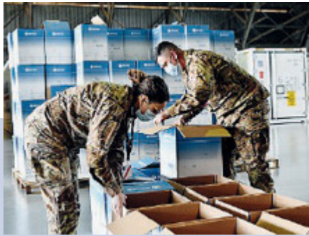
Da oggi in consegna 3 milioni di dosi /METRO

miglie in vacanza in Italia con circa un terzo della spesa di italiani e stranieri destinato alla tavola per consumare pasti in ristoranti, pizzerie, trattorie o agriturismi, ma anche per street food o specialità enogastronomiche.