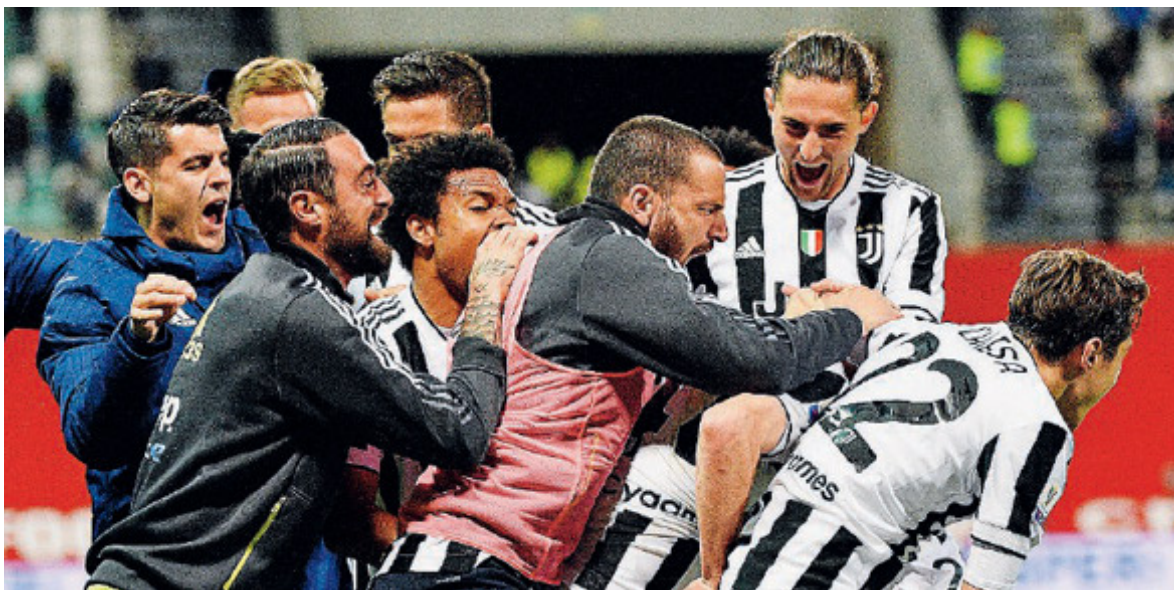
La Juve esulta: la Coppa Italia è sua.