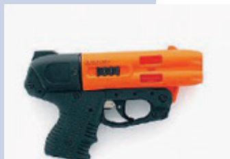
Pistola al peperoncino./

nota - che si tratta di dotazioni per difesa e non per offesa: vogliamo evitare che i nostri agenti debbano ritrovarsi ad avere un "corpo a corpo" con l'esagitato di turno, senza possedere l'adeguata strumentazione per tutelare la propria incolumità». Per l'assessore infatti «Troppi sono gli episodi che si registrano di aggressioni ai vigili, che svolgono un lavoro che sta diventando sempre più rischioso».