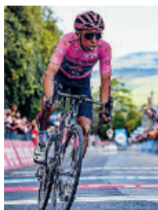
La maglia rosa.