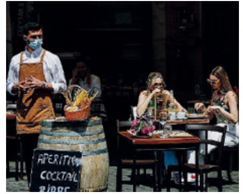
La riapertura vale 3,5 miliardi al mese di maggiori incassi /METRO

Il via libera era atteso infatti anche per sostenere