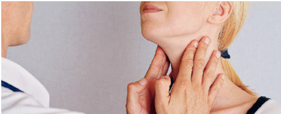
Sono oltre sei milioni gli italiani che soffrono di un problema alla tiroide