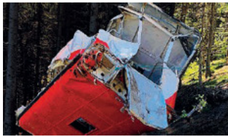
La cabina precipitata.