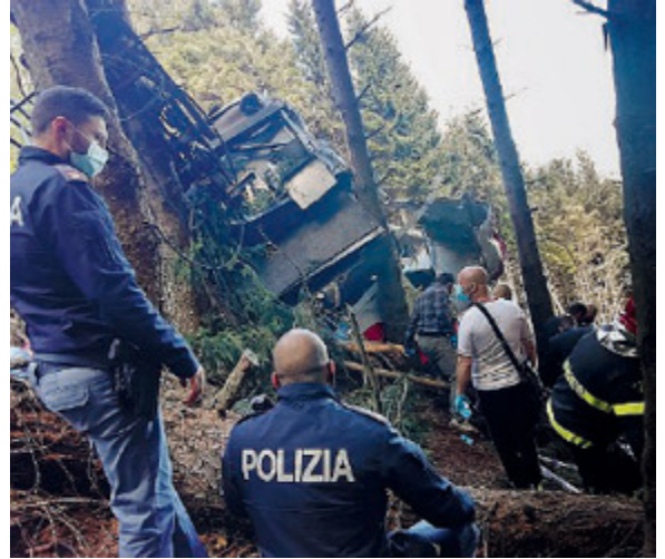
Le operazioni di soccorso

Stresa, 14 i deceduti tra i turisti in cabina Uno dei due bimbi gravi non ce l'ha fatta