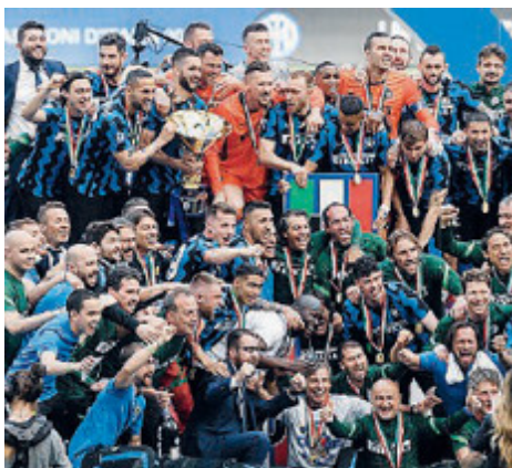
Festa scudetto dell'Inter dopo il 5-1 all'Udinese.

FORMULA 1 Benissimo la "pole" di Leclerc: peccato che il monegasco, per il disgraziato incidente di fine prova, abbia dovuto saltare la gara davanti al pubblico di casa sua. La consolazione per la Ferrari a Montecarlo è arrivata dal primo podio della stagione, con il 2° posto di Sainz. Bottino pieno per l'olandese Verstappen su Red Bull, che, con la dodicesima vittoria in carriera e la prima nel Principato, è balzato in testa al mondiale (terzo gradino per Lando Norris su McLaren). Ai piedi del podio l'altra Red Bull di Perez, seguito dall'ex ferrarista oggi all'Aston Martin Vettel, quinto. Il sette volte campione del mondo Lewis Hamilton su Mercedes è arrivato 7° perdendo la testa della classifica. Ottimo il 10° posto dell'Alfa Romeo di Giovinazzi.