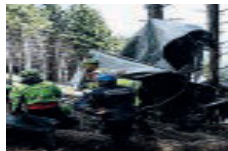
I resti della cabina