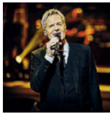
Claudio Baglioni presenta il suo evento "In Questa storia che è la mia" dal Teatro dell'Opera di Roma il 2 giugno, in streaming sulla piattaforma ITSART.